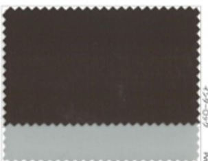
11 オリーブ (Olive)